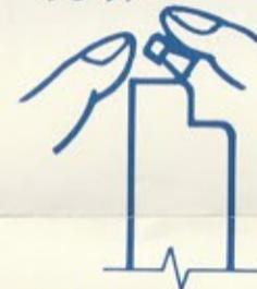
マガジン 弾つめ要領(図1)

※リリースボタン⑫を押し、ストックレール⑧を出入して下さい。(出しすぎると抜けません)