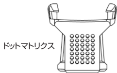
ドットマトリクス

爪だけでは不意に外れる場合がありますので、両面テープや接着剤などを併用して強固に取り付けてください。